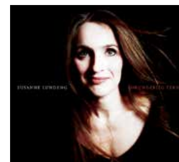
Forunderlig Ferd (2004), Kirkelig Kulturverksted