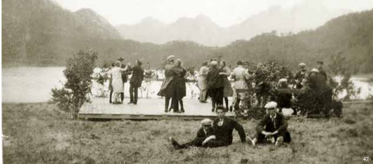
Plattingdans i Digermulen