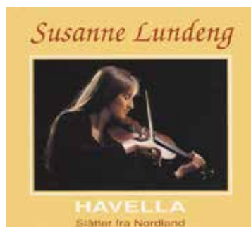
Havella (1991), Heilo