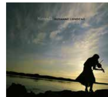
Nattevåk (2006), Kirkelig Kulturverksted