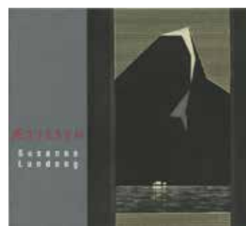
Ættesyn (1997) Kirkelig Kulturverksted