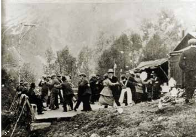
Fra jernbanefolkenes danseplatt i «Krabba» ved Tveråmo stasjon på Sulitjelmabanen, 1925.